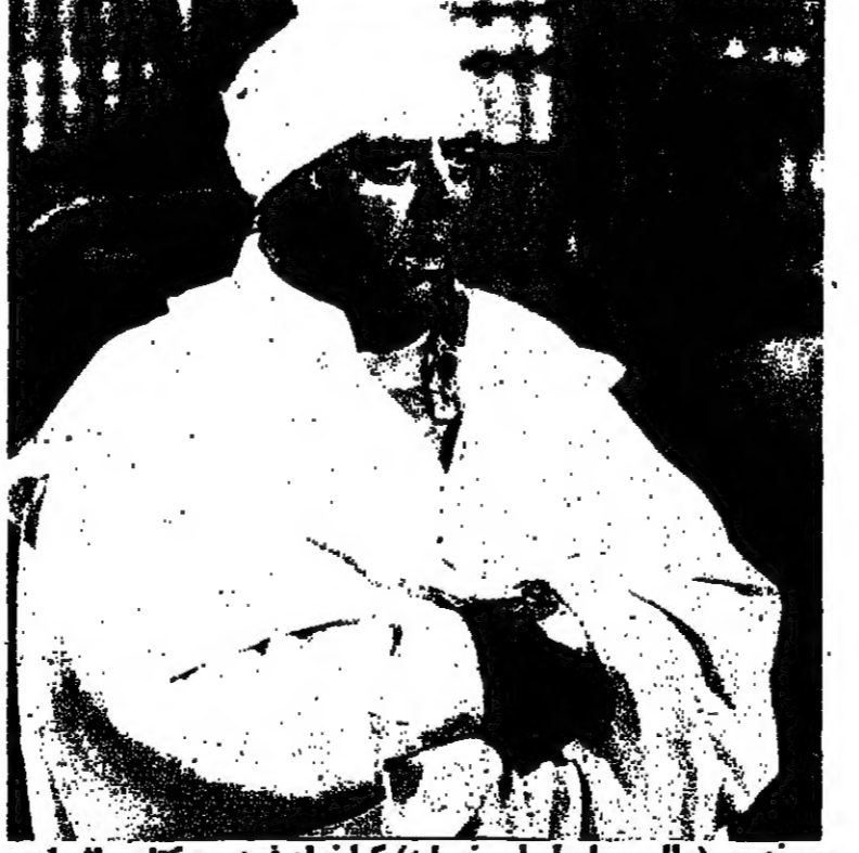
زيغوند بر (فظل مسلسل ايونيسايد) كما تراه في دوره كاتكر أنويت مصري في فيلم «المحنة صريح توت غنغ امون» . . . المتقرون الأسرائيلي - العاشرة والربع ليلا . . .